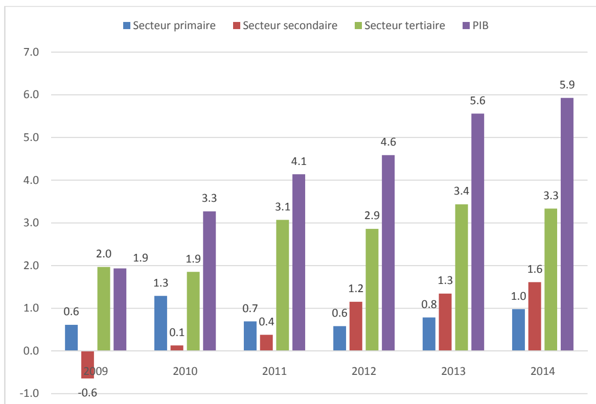
Graphique 25. 2: Contribution des secteurs à la croissance du PIB (en point)